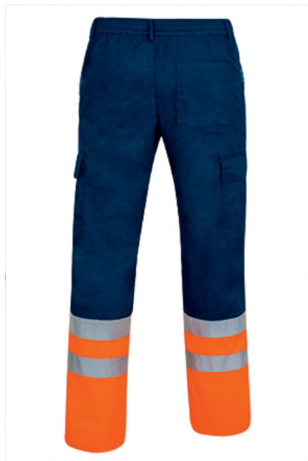
Vista parte trasera de la prenda