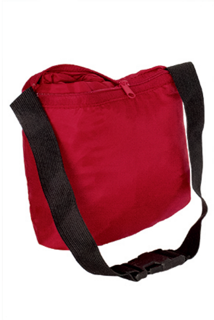
Detalle: chubasquero recogido