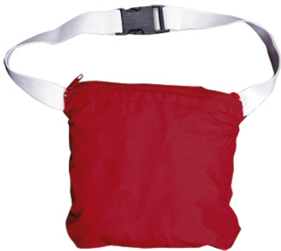
Detalle: chubasquero recogido