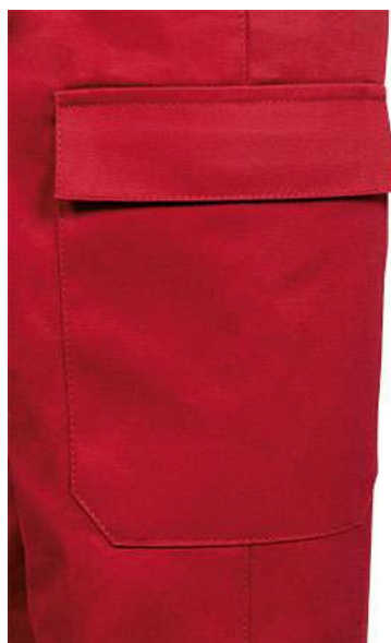
Detalle bolsillo lateral