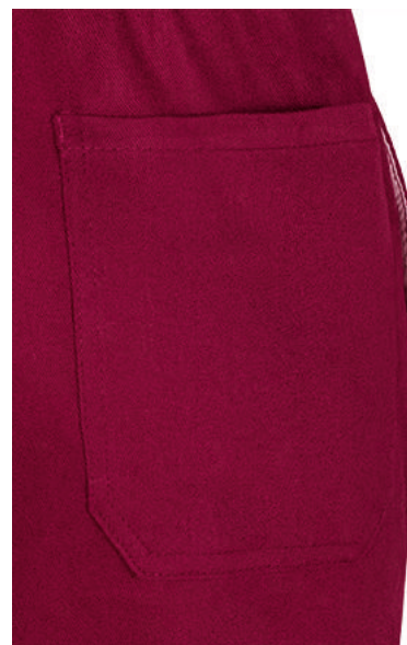
Detalle bolsillo trasero lado derecho