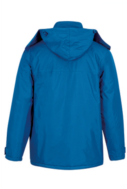
Vista parte trasera de la prenda (espalda)